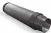
Flexibele slang 125 mm