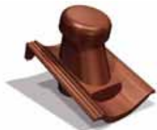
Doorvoerpan 100 mm