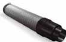
Flexibele slang 100 mm